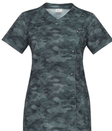
F018 Camouflage blu